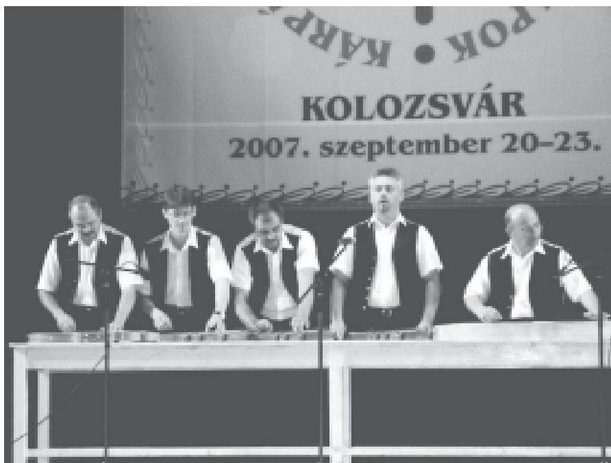
Fabotó citeraegyüttes a gálaműsoron

Az esti órákban a kultúrműsor két Kolozsvár környéki magyarok lakta településen, Tordaszentlászlón és Mérán folytatódott. A Fabotó citerazenekar a mérai közösségi ház udvarán, egy ötletesen átalakított kocsiszínben állt a népes számú közönség elé. A kevésbé ismert citerazenét nagy örömmel fogadta Méra apraja-nagyja, de a szakmabéliek is elismeréssel nyilatkoztak muzsikánkról. Nemcsak a közönségnek, de nekünk is nagy élmény volt a ott töltött kurta