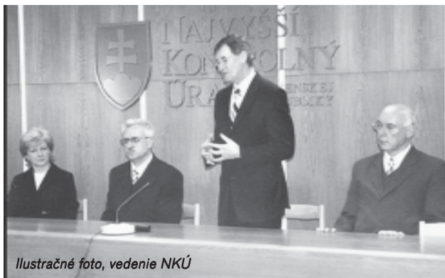
Ilustračné foto, vedenie NKÚ